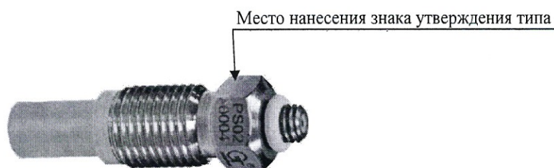
Рисунок 2 - Датчик динамического давления PS02