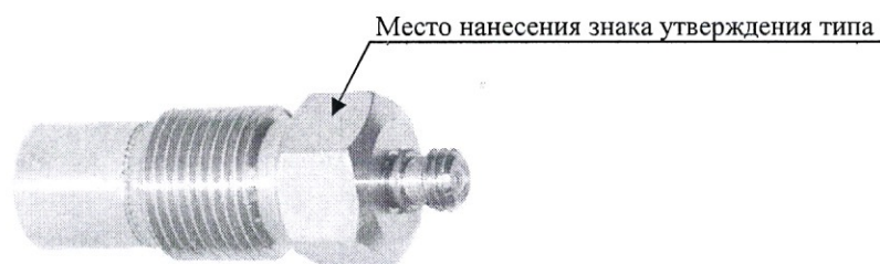
Рисунок 3 - Датчик динамического давления PS03

Метрологические и технические характеристики приведены в таблицах 2, 3, 4 и 5.